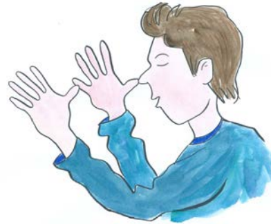
Doe je ogen dicht en zet beide handen met gespreide vingers, achter elkaar op je neus.