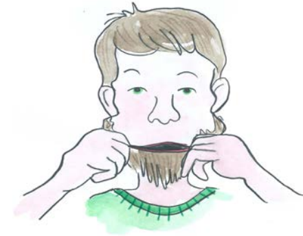
Trek je beide wangen uit.