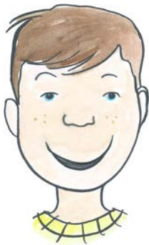
Kijk heel vriendelijk.